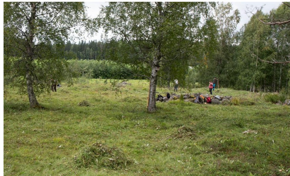
Fältgentiana på Karsbo äng.

Vi tar emot nomineringar till vårt Miljöpris för år 2023. fram till den 15/3 2025. Man kan nominera personer eller organisationer som gjort något bra för miljö eller natur i Norbergs kommun.