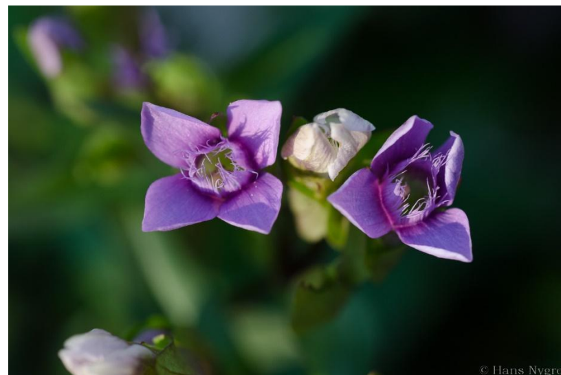
Fältgentiana på Karsbo äng.

Vi tar emot nomineringar till vårt Miljöpris för år 2023. fram till den 28/2 2024. Man kan nominera personer eller organisationer som gjort något bra för miljö eller natur i Norbergs kommun.