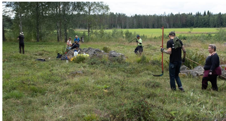
Slätter på Karsbo äng.

Vi tar emot nomineringar till vårt Miljöpris för år 2022. fram till den 28/2 2023. Man kan nominera personer eller organisationer som gjort något bra för miljö eller natur i Norbergs kommun.